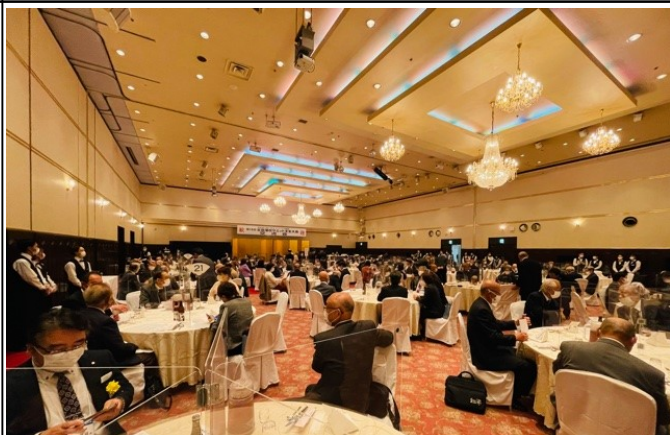
交流会：小山グランドホテル