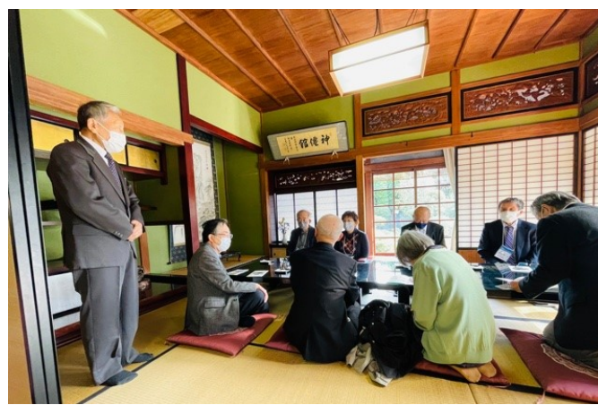
松本家見学と茶菓もてなし。松本先生のお話し