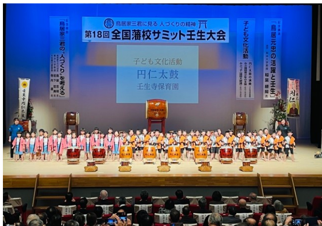
壬生寺幼稚園児による円仁太鼓演奏