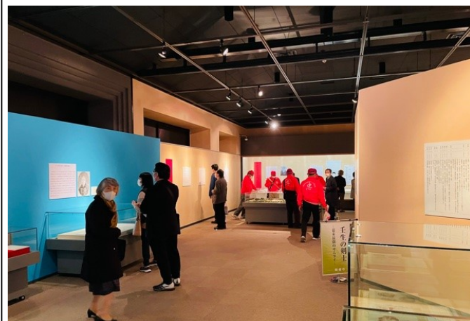
壬生町歴史民俗資料館：元忠公血染めの肌着も展示