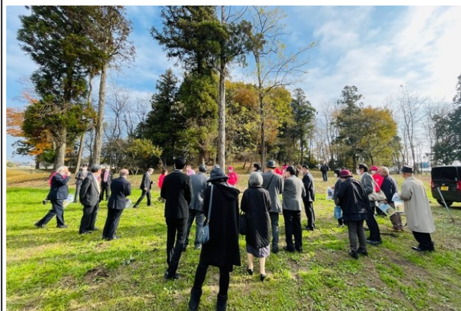
21日壬生町周回コース 車塚古墳・牛塚古墳見学