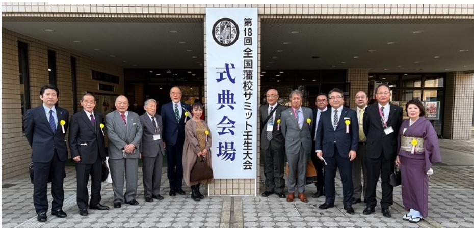
壬生ロータリークラブ会員