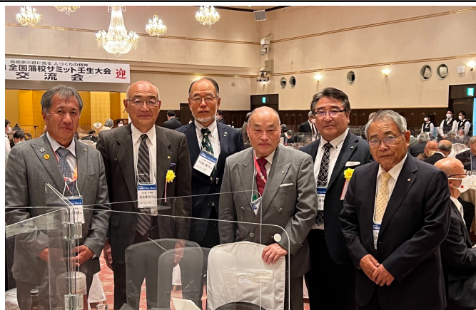
交流会：壬生藩テーブル