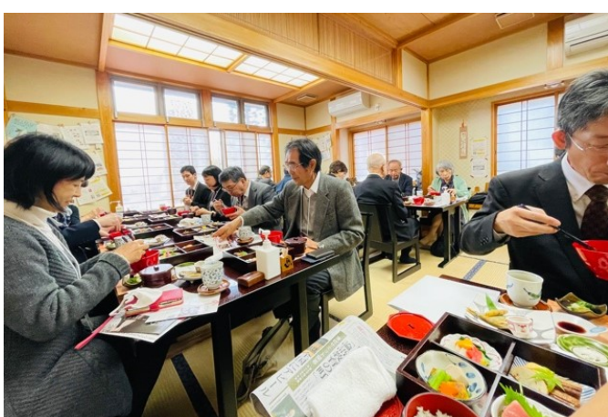
昼食はお殿様料理